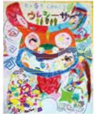
福島の子どもの保養プロジェクトで沖縄・球美の里に参加した子どもたちが描いたシーサーの絵

私たちは、球美の里が守り育ててきた大切なものを残していけるよう、体制や組織運営についても、大幅に見直しを行いました。今後も、より良い保養を続けていくため、球美の里の運営を「認定 NPO 法人 いわき放射能市民測定室たらちね」に移譲することを決め、12月8日の総会にて最終決議をいたしました。